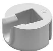
Quick kerek összehúzó vég D=35 mm

Az új Quick 35 munkalap összehúzó vasalat jelentősen megkönnyíti és gyorsítja a munkát, hiszen a vasalat a marásba pattintva ott marad, és egy imbuszkulcs segítségével a munkalap síkjára merőlegesen, néhány könnyed mozdulattal tudjuk elvégezni az összehúzási műveletet.