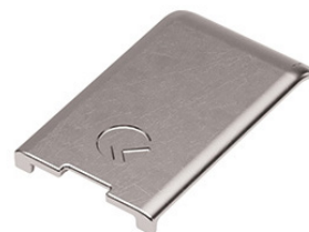
Kimana lenyíló lapospánt