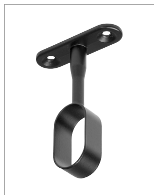
Függesztett ovális fém rúdtartó 12109 nyitott matt fekete