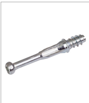
TL01 Excenter szár, famenetes

Az új, TL01 és TL03 excenter szárok formailag különböznek elődjeiktől (TE01 és TE03), ezért új néven és cikkszámra érhetőek el. A funkció ugyanaz maradt.