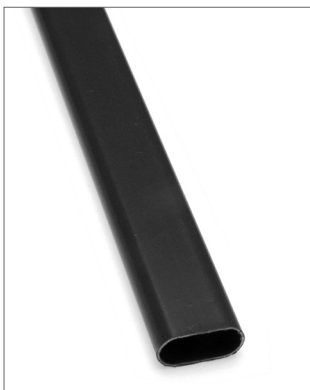
Ovális vállfatartó rúd matt fekete