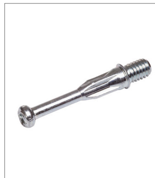
TL03 Excenter szár, metrikus menettel