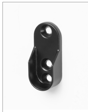
Ovális fém rúdtartó 12101 matt fekete