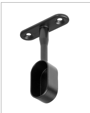
Függesztett ovális fém rúdtartó 12110 zárt matt fekete